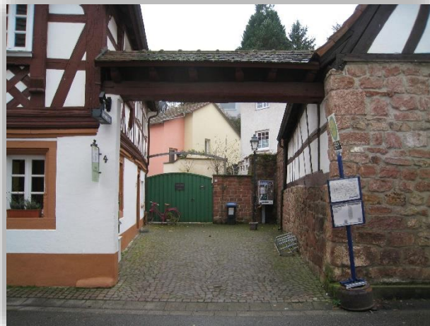
Büro für Tourismus des Landau-Land e.V.